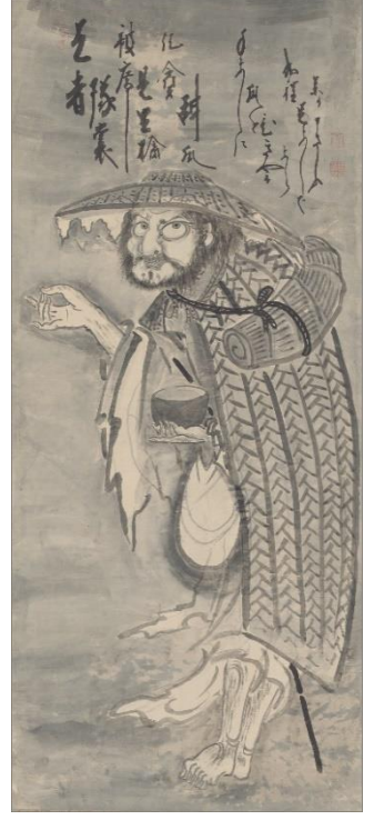
大灯国師 (永青文庫所蔵)