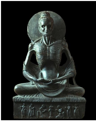
ブツダの苦行像