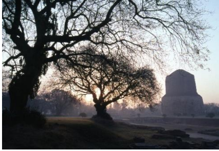
ブツダが初めて教えを説かれた地・サルナート