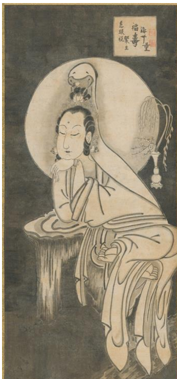
白衣観音 (松蔭寺所蔵)