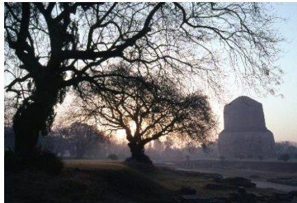
ブツダが初めて教えを説かれた地・サルナート