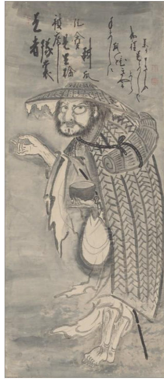
大灯国師（永青文庫所蔵）