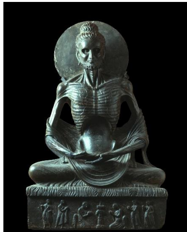
ブツダの苦行像