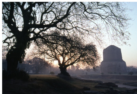
ブッダが初めて教えを説かれた地・サルナート