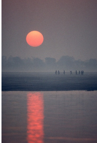
ガンジスの夜明け